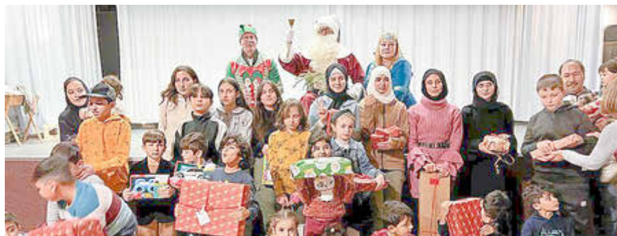
Asylsuchende Kinder feiern Weihnachten